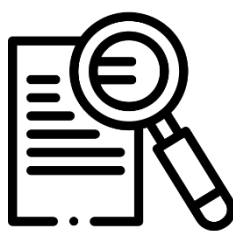
Servicios de Investigación Aplicada