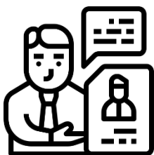
Servicios de Consultoría/Asesoramiento